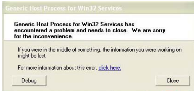
รูปที่ 1.1 ข้อความเตือน Generic Host Process...

อาการของปัญหา ผู้ใช้งานใช้คอมพิวเตอร์ได้สักระยะ จะมีหน้าต่างข้อความเตือนว่า “Generic Host Process for WIN32 Service” มีปัญหา เมื่อผู้ใช้งานได้ปิดหน้าต่างของข้อความ อาจทำให้ผู้ใช้งานไม่สามารถใช้โปรแกรมต่าง ๆ ได้ หรือไม่สามารถใช้งานระบบเครือข่ายรวมทั้งอินเทอร์เน็ตด้วย ผู้ใช้งานต้องทำการ Restart เครื่องใหม่ จึงจะสามารถใช้งานได้ แต่พอใช้งานได้สักระยะปัญหานี้ก็เกิดขึ้นอีก ดังรูปที่ 1.1 และ 1.2